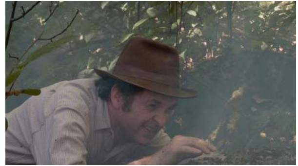
Les reliques de Beardmore Dossiers Mystère / CANAL D, 2012