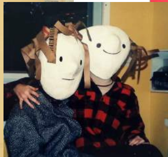
Ateliers multi-art dans la nature École Christ-Roi, Saint-Camille, 2002