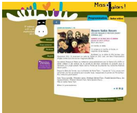
Fous comme des balais, 2017