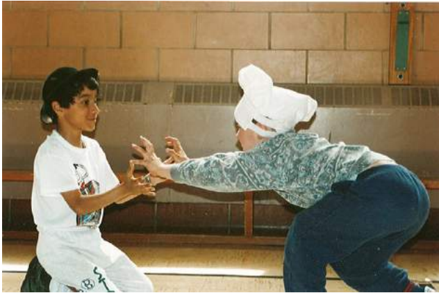
École De Lanaudière, Montréal, 1993–1995