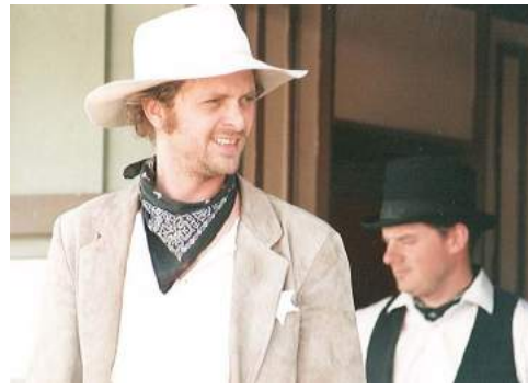
Village du Far-West de Saint-Césaire, Théâtre, musique et cascades 1992