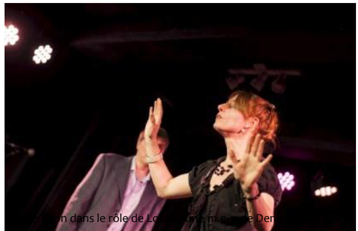
on dans le rôle de Louise Marie-madeleine Des