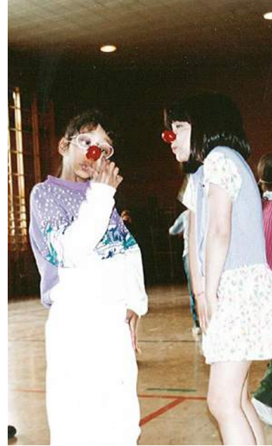
École Christ-Roi, Saint-Camille, 2005