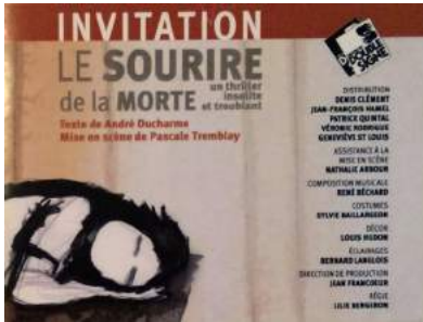
Le sourire de la morte, Théâtre