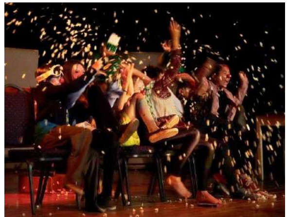
Des masques pour la vie, 2021