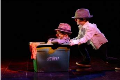
Masques et Motion, 2013