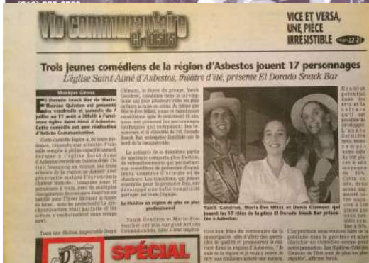
El Dorado Snack Bar Théâtre d'été d'Asbestos