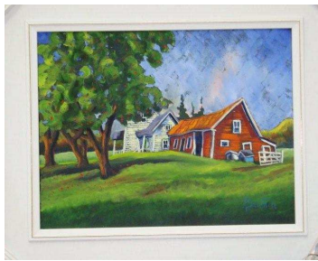
Toile offerte par Renald Gauthier

Une campagne de financement populaire de 100 000 $ est en cours actuellement pour permettre la réalisation d'un projet transformant l'école Castonguay d'Asbestos en 16 logements pour personnes âgées autonomes et semi-autonomes. Ces logements seront adaptés, subventionnés et avec services d'aide domestique. Le projet de 2 millions $ est sous le leadership de Ressource en entretien ménager. Il a reçu un accord de financement de la Société d'habitation du Québec et le support de bailleurs de fonds du milieu, tels la caisse Desjardins des Métaux blancs et le CLD des Sources. Le projet est également soutenu par la Ville d'Asbestos, par la réduction de taxes, et par la Commission scolaire des Sommets qui a offert une transaction avantageuse pour l'acquisition du bâtiment. Le directeur général de l'établissement, Mario Morand, a accepté de présider la campagne de financement.